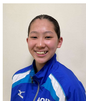
ひがし 稲田 紡