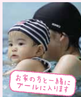
お家の方と一緒に プールに入ります

水の中に入ることで赤 ちゃんの発育や発達につ ながり体も強くなります。 また体を動かすことでお 家の方のストレス解消に もなり、ダブル効果が得ら れます。