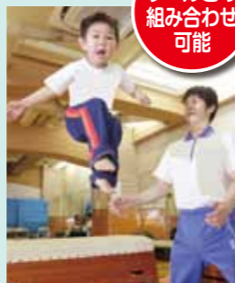
プールとの 組み合わせ 可能

跳箱、縄跳び、鉄棒、マット 運動など多様な運動種 目を通じて、子どもたちの 運動神経の発達と体力 の向上を促します。