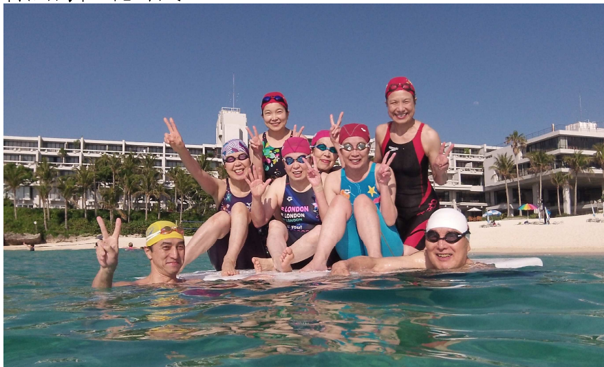
ホテルのプライベートビーチにて